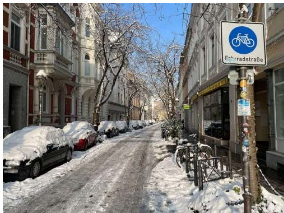
Breite Straße, 18.1.24 13:00 Uhr, die Fahrradstraße ist schneebedeckt

Genauere Infos zu den beiden Terminen gibt es im Touren- und Terminportal des ADFC Bonn.