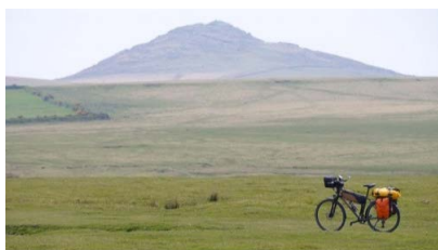
Radreisevortrag: LEJOG - Großbritannien von unten bis oben