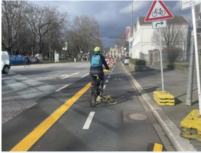
Verkehrersuch Adenauerallee