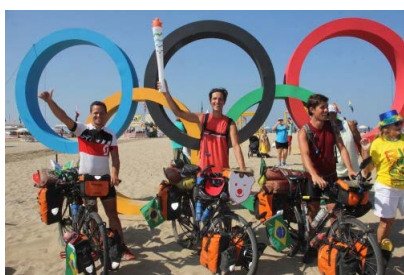
Trio für Rio

Dies ist der letzte Vortrag für diese Saison: Nun ist es wieder an der Zeit, selbst Touren zu unternehmen, um dann ab Herbst von neuen interessanten Fahrradreise-Erlebnissen zu berichten.