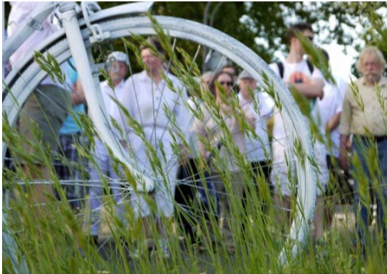
Ride of Silence