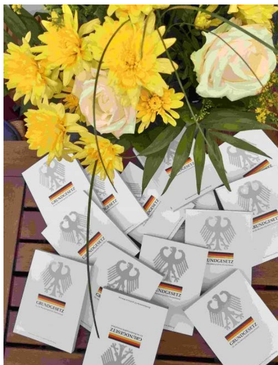
Das Grundgesetz © Bernhard Meier