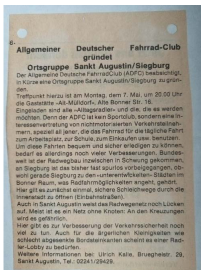
Zeitungsausschnitt zum Gründungstreffen der OG Sankt Augustin/Siegburg von 1984 © Stadt Sankt Augustin