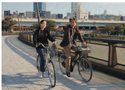
"Perfect Days"