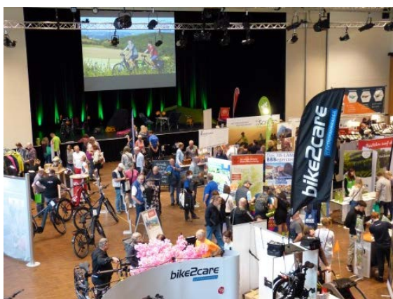
Viele neue Eindrücke und Inspirationen gab es auf der Messe

Zum 14. Mal veranstalten WestLotto und die Nordrhein-Westfalen-Stiftung die viertägige NRW-Radtour für Freizeitradler*innen, die in diesem Jahr durch das östliche Ruhrgebiet und die Soester Börde führt. Ein 16-köpfiges ADFC-TourScout-Team begleitet die rund 1.000 Radbegeisterten und sorgt für einen reibungslosen Ablauf. Die Tour führt in vier Etappen von Hamm nach Dortmund, am zweiten Tag von Dortmund nach Datteln und Castrop-Rauxel zurück nach Dortmund, von Dortmund nach Soest und am letzten Tag zurück von Soest nach Hamm. Details sowie Anmeldemöglichkeiten für Tages- und Dauerteilnehmer*innen gibt es hier .