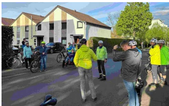
Radpolitische Tour