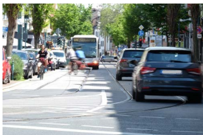
Noch herrscht Hektik auf der Friedrich-Breuer-Straße in Beuel

zweijährigen Beteiligung der Bürger*innen und Gewerbetreibenden.