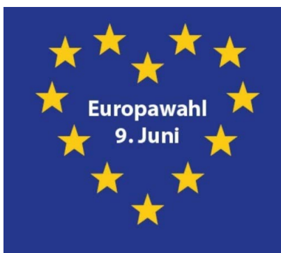
Ein Herz für Europa? Am 9.6. wählen gehen!

Die 21 Boxen sollen nun an den drei Standorten „Kaiserstraße“, „An der Elisabethkirche“ und „Wilhelm-Levison-Straße“ per Videotechnik rund um die Uhr überwacht werden. „Dabei halten wir uns selbstverständlich an alle datenschutzrechtlichen Vorgaben. Die Planungen dazu haben bereits mit unserer Partnerin der Bonner City Parkraum GmbH begonnen. Auch eine bessere Ausleuchtung vor Ort ist im Gespräch,“ teilen die Stadtwerke als Eigentümerin mit.