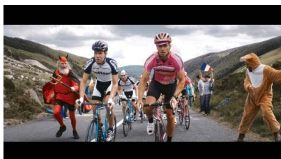
"The Racer"