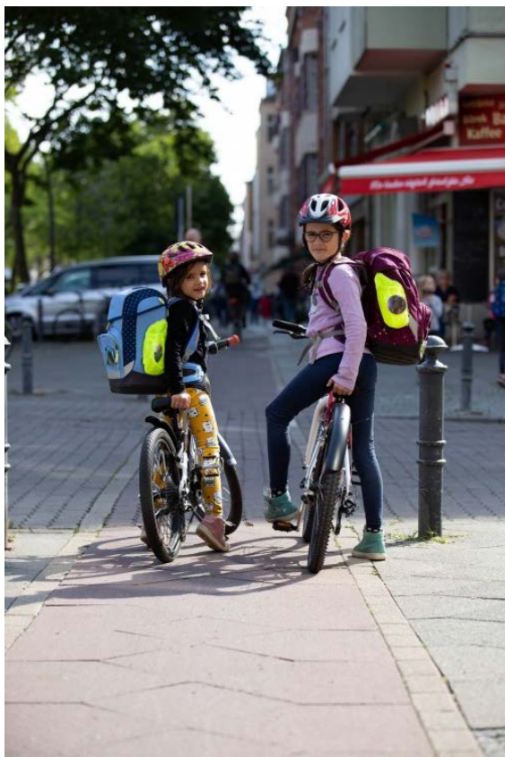
Sichere Wege für alle - dafür Mitglied werden im ADFC!