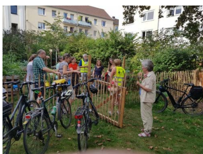
Klimaradtour früherer Jahre

Noch unschlüssig, wen wählen? Hier gehts zum Wahl-o-mat der Bundeszentrale für politische Bildung , aber auch andere haben die Wahlprogramme der Parteien analysiert und aufbereitet: Hier gibt es den Science-o-mat , den Klimawahlcheck und sogar einen Wahlswiper!