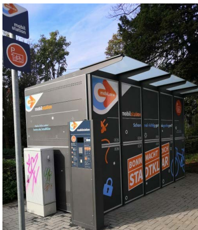
Fahrradboxen repariert © Bernhard Meier